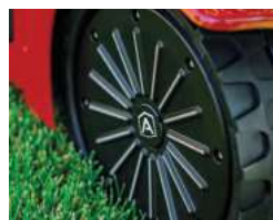
Miękkie, gumowe koła tylne Flex rubber wheel