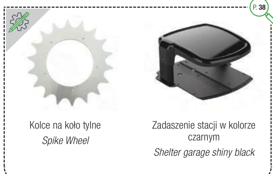
Kolce na koło tylne Spike Wheel