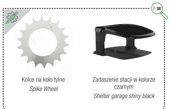
Kolce na koło tylne Spike Wheel