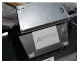
Dotykowy wyświetlacz Touchscreen Display

System koszenia SDM (Satellite Dynamic Memory) Satelitarny system nawigacji, oparty na zaawansowanych algorytmach, pozwala kosiarce rozpoznać właśnie skoszony obszar. Tworzy ona wirtualną mapę i zapamiętuje czasy pracy dla każdego obszaru, zapewniając w ten sposób oszczędność czasu i większą wydajność. SDM Cutting System (Satellite Dynamic Memory) The satellite navigation system, based on advanced algorithms, allows the robot to recognise the areas just mowed. The robot then creates virtual maps and remembers the working times used for each area, saving time and increasing efficiency.