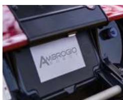
Wyświetlacz dotykowy Touchscreen Display

System koszenia SDM (Satellite Dynamic Memory) Satelitarny system nawigacji, oparty na zaawansowanych algorytmach, pozwala kosiarce rozpoznać właśnie skoszony obszar. Tworzy ona wirtualną mapę i zapamiętuje czasy pracy dla każdego obszaru, zapewniając w ten sposób oszczędność czasu i większą wydajność. SDM Cutting System (Satellite Dynamic Memory) The satellite navigation system, based on advanced algorithms, allows the robot to recognise the areas just mowed. The robot then creates virtual maps and remembers the working times used for each area, saving time and increasing efficiency.