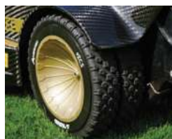
Miękkie, gumowe koła tylne Flex rubber wheel