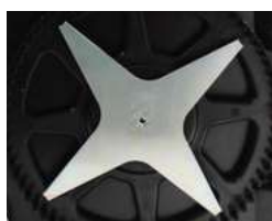
Nóż 4 ramienny 4 point star blade