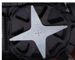
Nóż 4 ramienny 4 point star blade