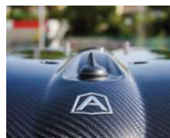
Lekka i wytrzymała pokrywa z karbonu Lightweight and robust carbon cover