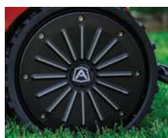
Miękkie, gumowe koła tylne Flex rubber rear wheel