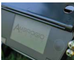
Dotykowy wyświetlacz Touchscreen Display

System koszenia SDM (Satellite Dynamic Memory) Satelitarny system nawigacji, oparty na zaawansowanych algorytmach, pozwala kosiarce rozpoznać właśnie skoszony obszar. Tworzy ona wirtualną mapę i zapamiętuje czasy pracy dla każdego obszaru, zapewniając w ten sposób oszczędność czasu i większą wydajność. SDM Cutting System (Satellite Dynamic Memory) The satellite navigation system, based on advanced algorithms, allows the robot to recognise the areas just mowed. The robot then creates virtual maps and remembers the working times used for each area, saving time and increasing efficiency.