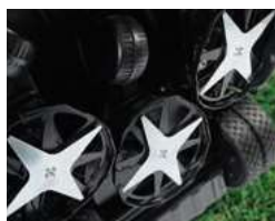
Nóż 4 ramienny 4 point star blade